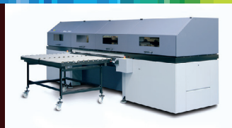
Durst Rho Veľkoplošná UV tlačiareň, ktorá priamo potláča doskové materiály.