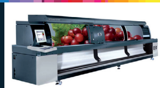
HP Scitex XLJet 1500 Veľkoplošná digitálna tlačiareň s najväčšou šírkou tlače až 5 metrov.