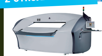
HP Scitex TurboJet 8350 Najrýchlejšia veľkoplošná digitálna tlačiareň na svete s rýchlosťou tlače až 500 m 2 /hod.