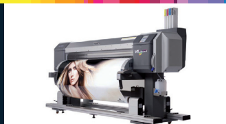
Mutoh ValueJet Veľkoplošná digitálna tlačiareň s vysokým rozlíšením až 1440 DPI.